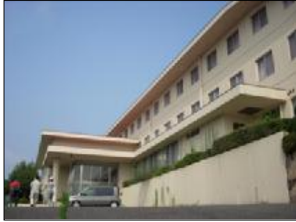
吉備ETCを出ると北側の丘に見えます